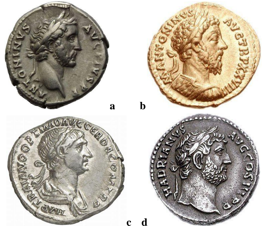
a - cisár Antoninus Pius (86 – 161 n.l.) adoptívny otec Marca Aurelia; b – správna odpoveď = cisár Marcus Aurelius (121 – 180 n.l.); c – cisár Traianus (53 – 117 n.l.) adoptívny otec cisára Hadriana; d - cisár Hadrianus (76 – 138 n.l.) adoptívny otec Antonina Pia

▣ Teraz skúste zistiť na ktorej minci je zobrazený cisár Marcus Aurelius (podobizne cisárov majú portrétné črty, riešenie nájdete pod obrázkom).