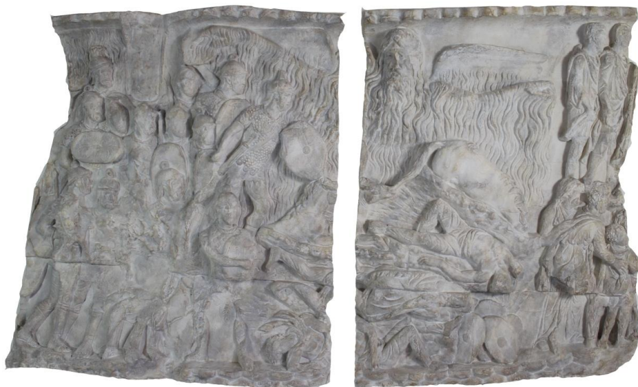
Scéna XVI - Zázračný dážď