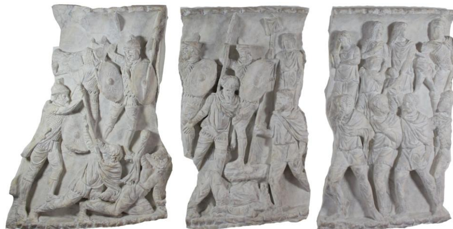
Scény LXVIII a LXIX – Zabíjanie barbarov a Odvádzanie barbarov (Kotínov? Sarmatov?) do zajatia